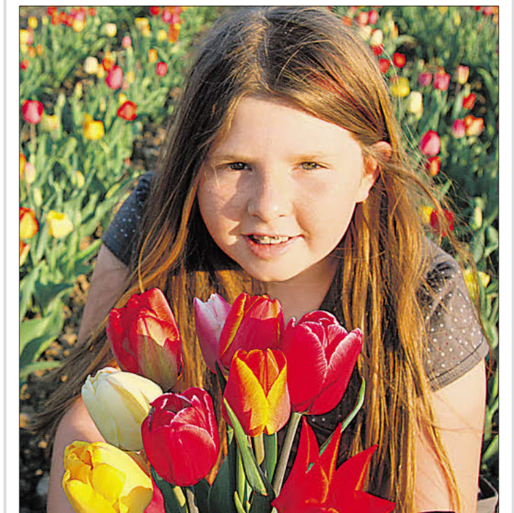
Ab ins Tulpenfeld oder einfach in eine sommerliche Blumenwiese. Die farbenprächtigen duftenden Blüten zaubern bestimmt jeder Mama ein Lächeln aufs Gesicht. Blumen stehen nicht zu Unrecht als Geschenk zum Muttertag ganz oben auf der Liste der beliebtesten Geschenke.