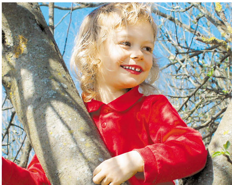
Wichtigstes Anliegen der Kinderlobby: Das Kind Kind sein lassen.